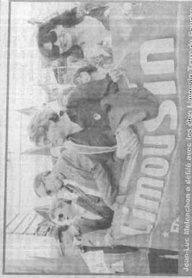
Jean-Luc Melonchon a défilé avec les élus Linnouza Terre de Coeur.