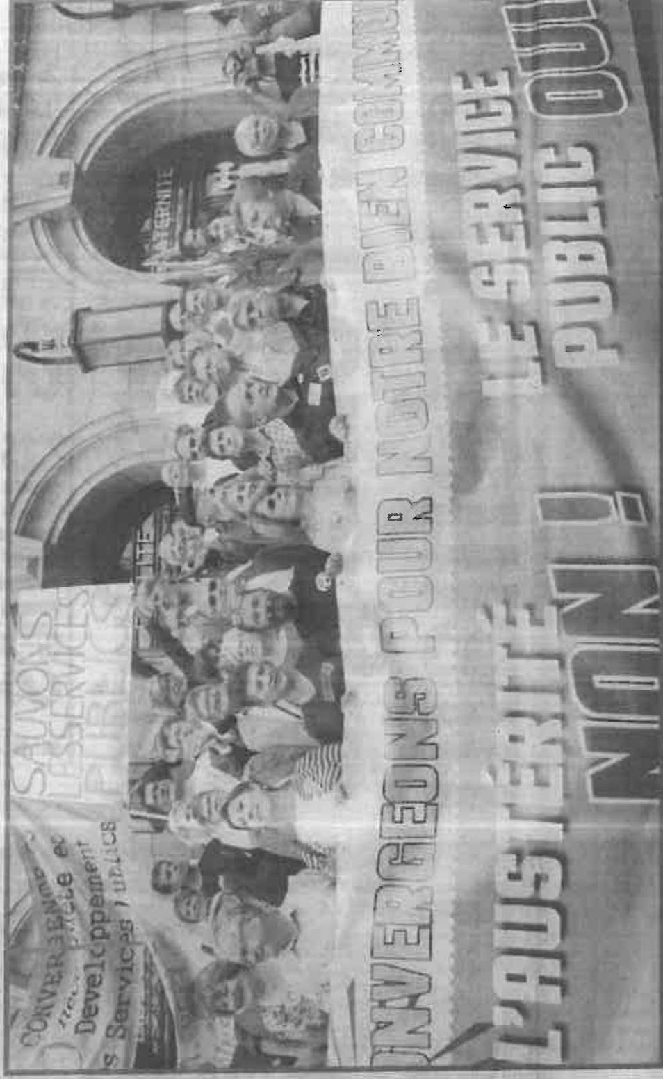
La manifestation pour la défense des services publics a été lancée par la traditionnelle photo de famille.

contre la suppression des services publics. L'Espagne a entamé un changement profond mais elle n'est pas au bout. Ils se disent qu'il est possible de faire autre chose. C'est possible en France. Nous pensons que d'un point de vue du gouvernement, c'est possible. Chaque pays a sa spécificité mais on sent le même mouvement profond : le refus des politiques d'austérité».