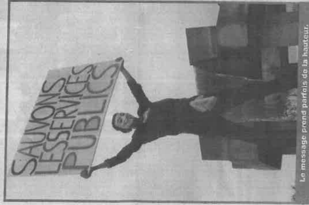
Le message prend parfois de la hauteur.

Plus de 5.000 personnes selon les organisateurs, 2.200 selon la police se sont déplacées à Guéret ce samedi pour la manifestation nationale pour la défense des services publics. Ils en ont maré de voir les horaires des bureaux de poste se réduire comme peau de chagrin, les trésoreries fermer les uns après les autres, un système de santé à deux vitesses apparaître ou encore les trains être remplacés par des cars... Dix ans après une première manifestation d'ampleur, ils ont réaffirmé leur message et veulent réinventer les services publics pour créer ceux du XXI e siècle. Ce dans une ambiance conviviale, chaleureuse et festive saluée par un TER