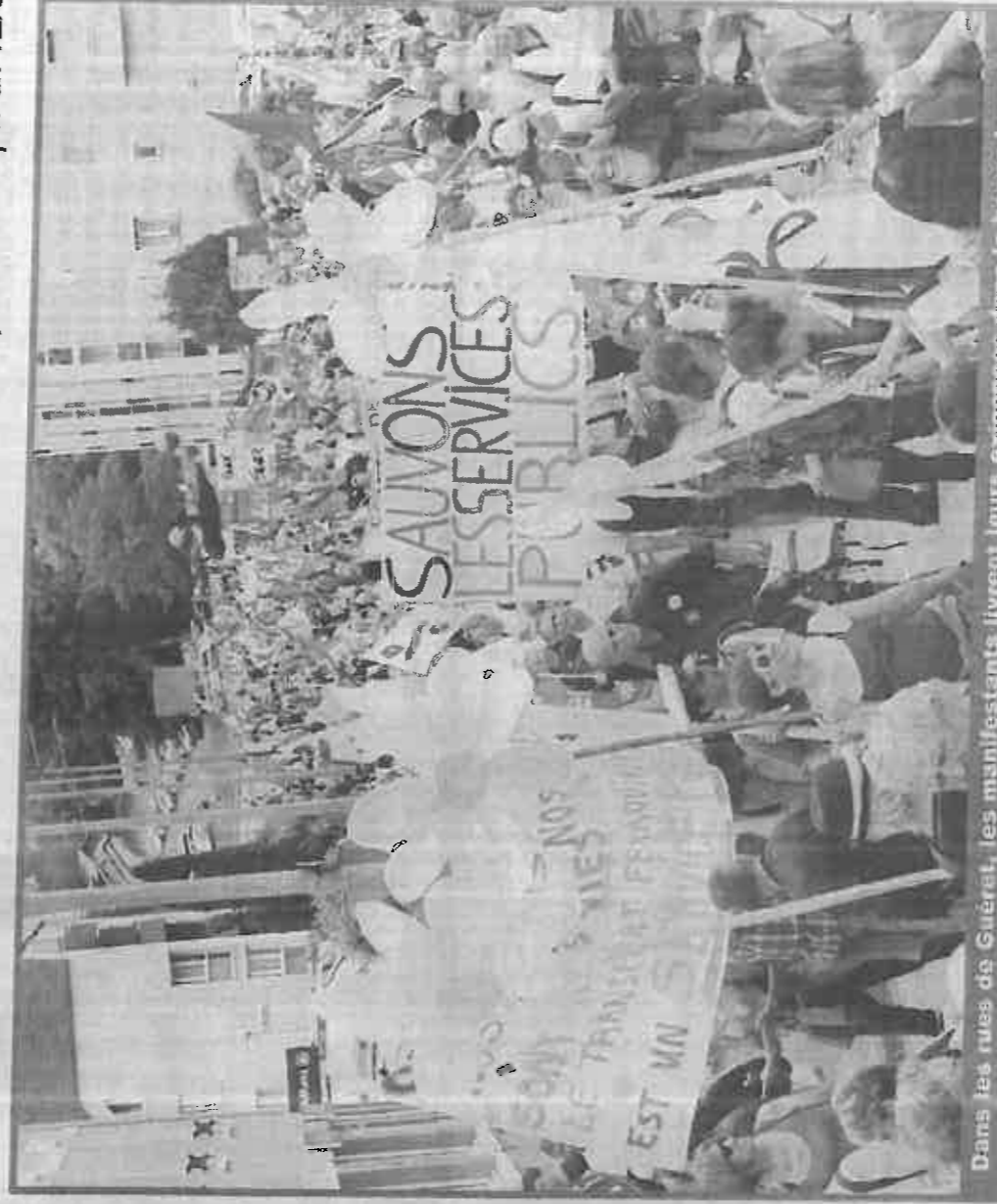
Dans les rues de Guéret, les manifestants livrent leurs exigences dans la bonne humeur.