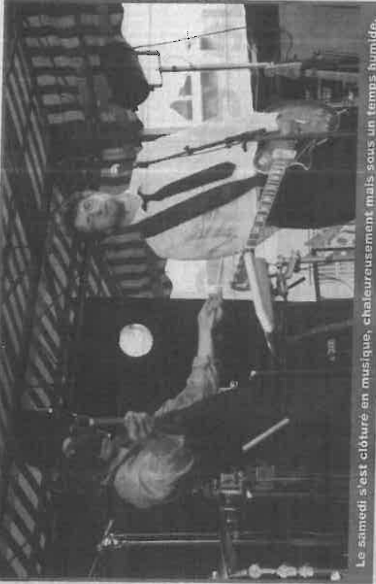
Le samedi s'est clôturé en musique, chaleureusement mais sous un temps humide.