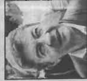
JEAN-LUC MÉLENCHON, COORDONNATEUR DU PG

«Nous sommes à un moment charnière, le gouvernement accélère dans une direction catastrophique pour le pays et les territoires. Il faut à tout prix se poser la question de l'avenir des services publics. Je souhaite vivement que les élections régionales permettent un rassemblement le plus large possible pour faire la démonstration que les services publics sont une idée moderne. Je souhaite qu'un jour toute cette énergie positive puisse s'incarner dans les politiques publiques».