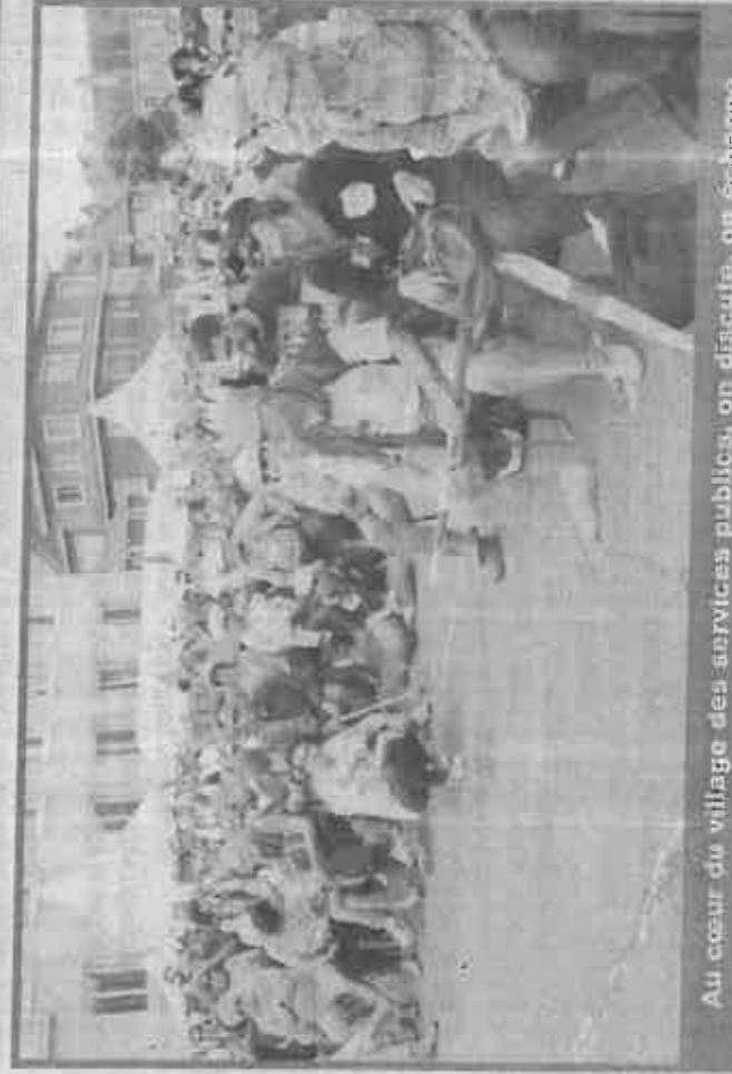
Au cœur du village des services publics, on discute, on échange.