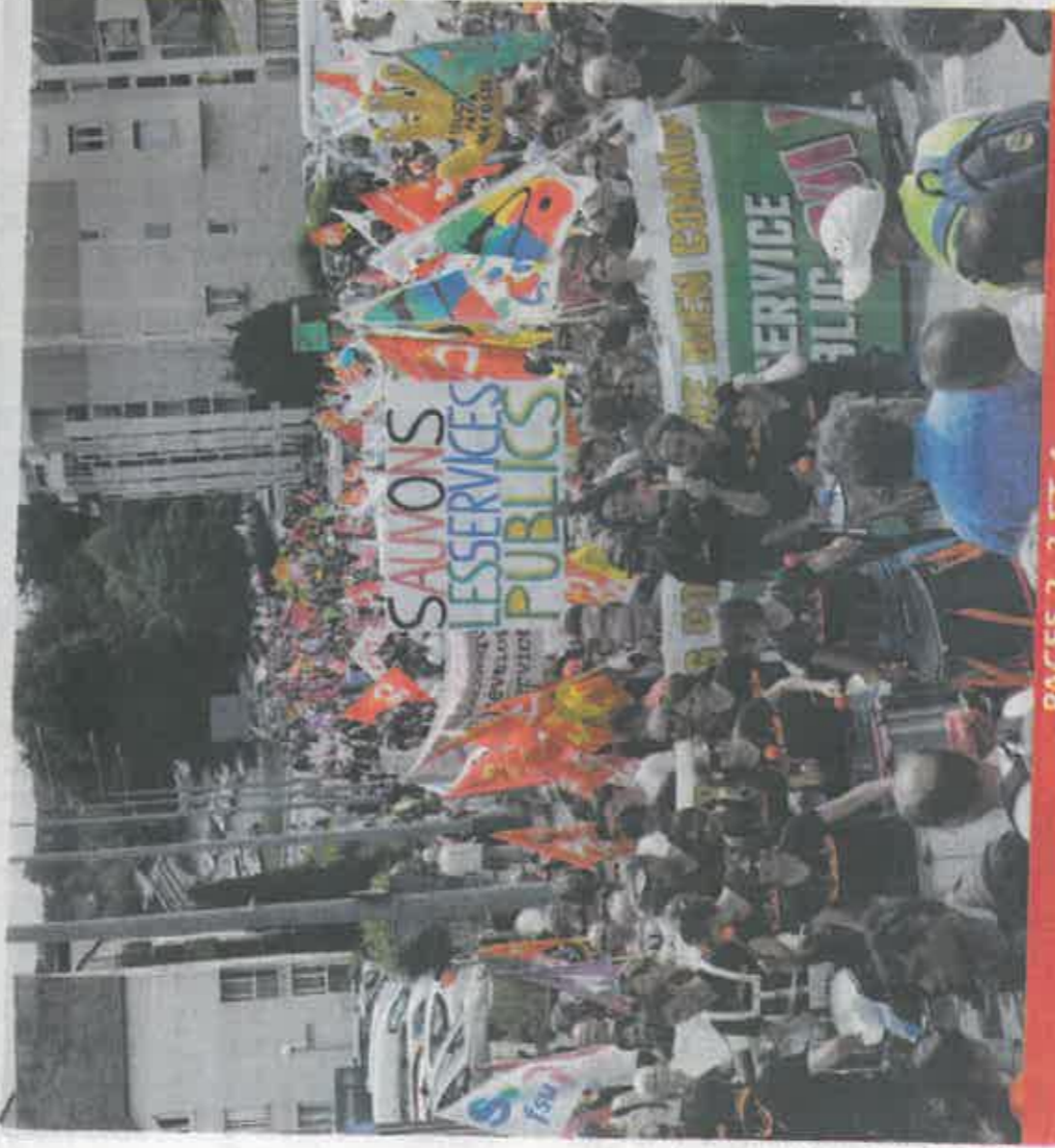
PAGES 2, 3 ET 4